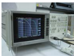
▲HP社 Network Analyzer

なぜなら、オーディオ機器を動作させているエネルギーはすべてコンセントの AC100V から来ているもので、そこには送電される際に非常に多くのノイズが混入してきます。もちろんノイズでも低い周波数のものは耳に聞こえてしまうノイズも稀にありますが、音質に非常に大きく影響しているのが「高周波ノイズ」です。